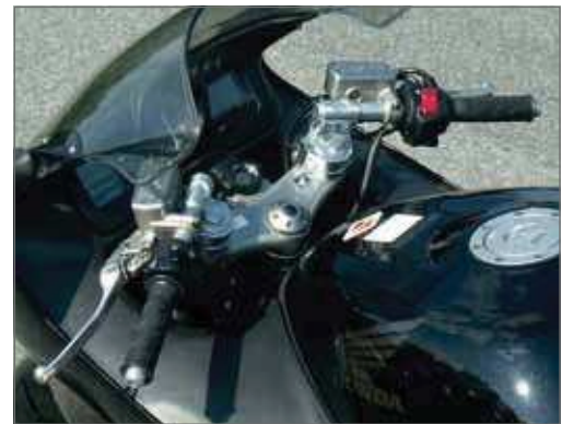
Honda CBR 1100XX

B: Begrenzen des Lenkanschlages erforderlich (2 mm) S: Ausschneiden der Verkleidungsspitzen erforderlich