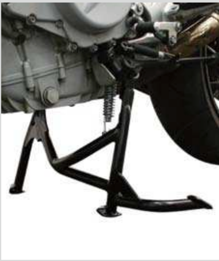
BMW F 800 S/F 800 ST.