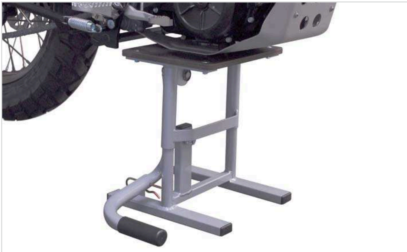
Hubständer M (Orange).