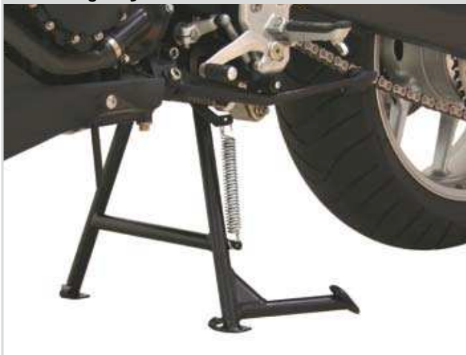
TRIUMPH Tiger 1050.